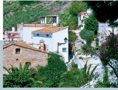
BARRIO DEL POU