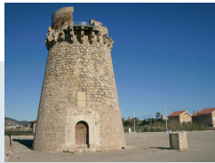
TORRE DEL MARENYET