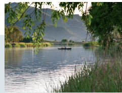
LAGO DEL "ESTANY"