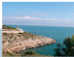
MIRADOR DEL FARO