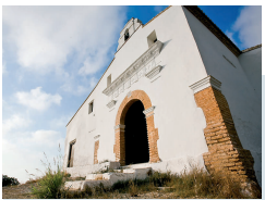
MUSEO DEL ARROZ