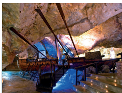
MUSEO DEL PIRATA